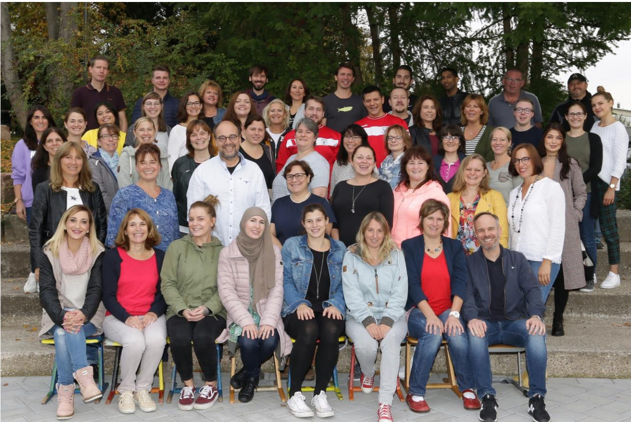
Foto 2019 • Corona bedingt konnte kein aktuelles Bild aufgenommen werden

Schulleitung • Grundschullehrkräfte • Förderschullehrkräfte • Referendare • Lernzeitbegleiter • Teilhabeassistenten • Sozialpädagogin • Sozialarbeiterin • Hortmitarbeiter • Sekretärin und Hausmeister und andere Mitarbeiter arbeiten zusammen