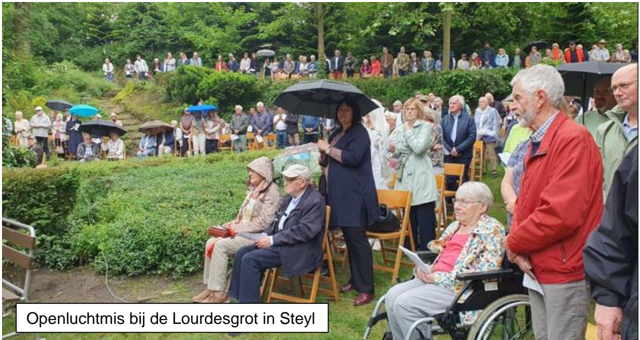
Openluchtmis bij de Lourdesgrot in Steyl