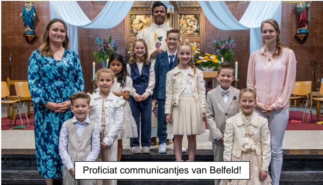
Proficiat communicantjes van Belfeld!