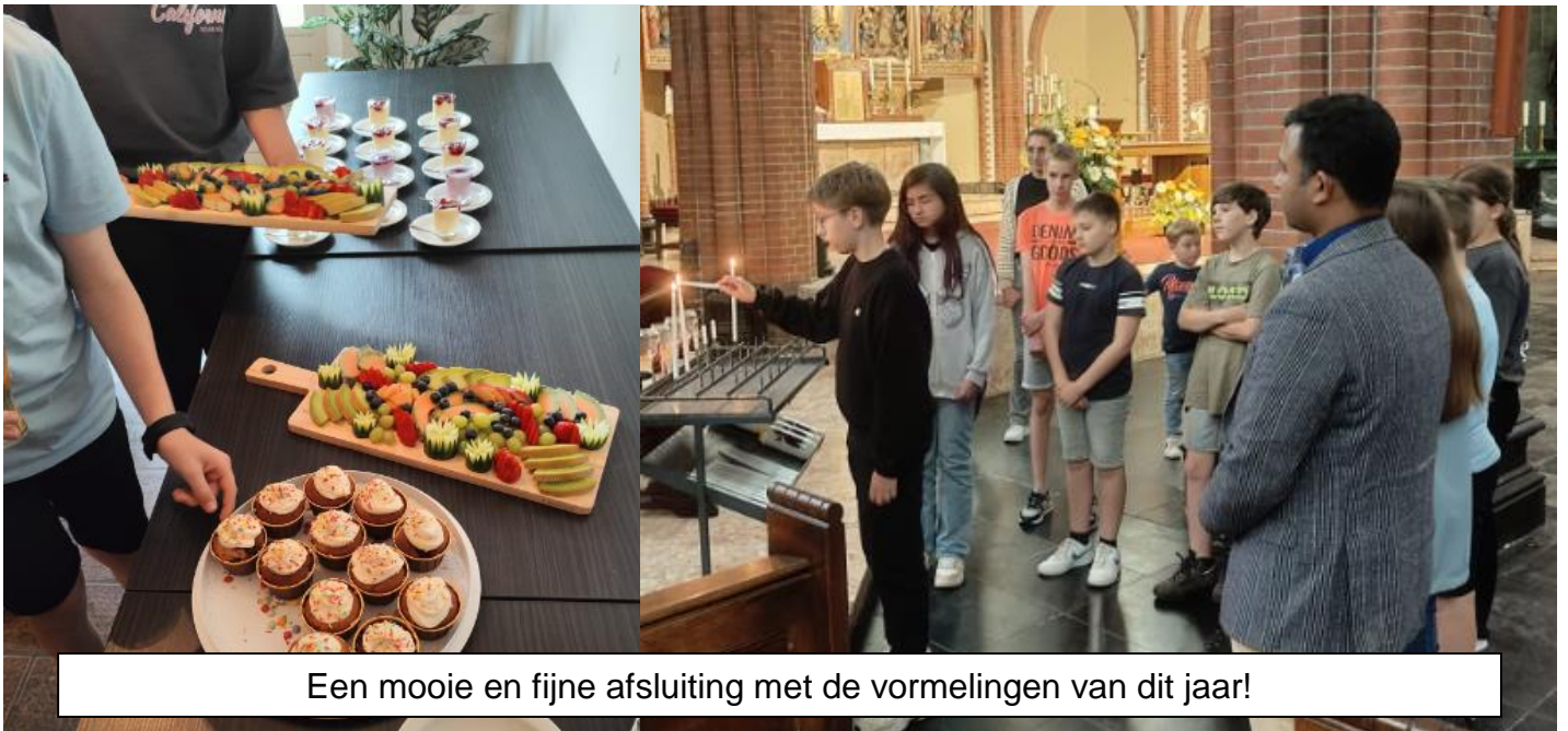
Een mooie en fijne afsluiting met de vormelingen van dit jaar!