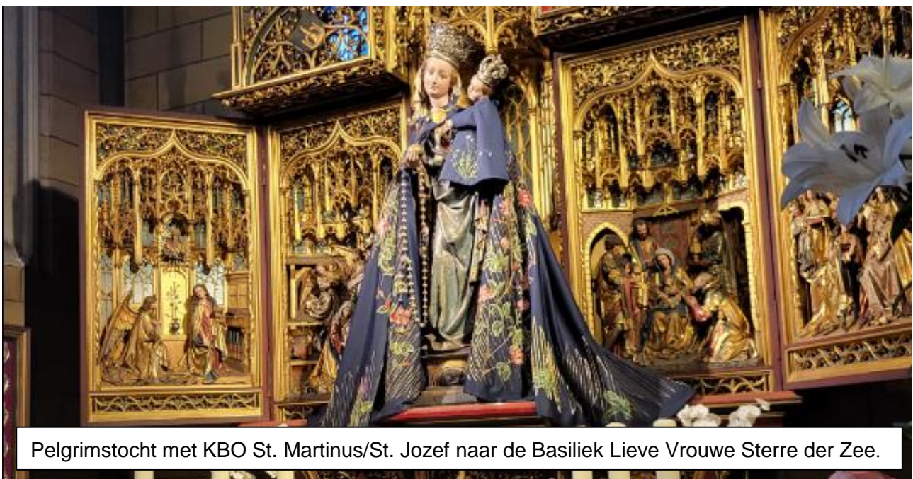
Pelgrimstocht met KBO St. Martinus/St. Jozef naar de Basiliek Lieve Vrouwe Sterre der Zee.