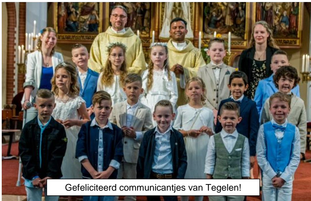
Gefeliciteerd communicantjes van Tegelen!