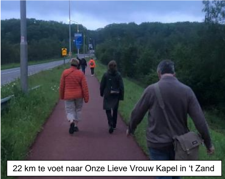
22 km te voet naar Onze Lieve Vrouw Kapel in 't Zand

Heer onze God, in Maria hebt Gij ons getoond wat geloven betekent: Steeds weer op weg gaan naar een onbekende toekomst. Moge haar geloof ons blijvend inspireren. Laat in ons groeien, een sterke hoop en een grote toekomstverwachting. Moge haar danklied ook ons lied worden tot U. Dat vragen wij door Christus onze Heer.