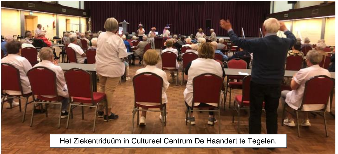
Het Ziekentriduüm in Cultureel Centrum De Haandert te Tegelen.