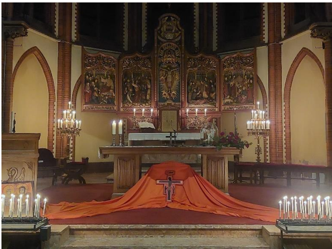
(foto: Rustgevend Taizé Viering in de Sint Martinuskerk Tegelen. Met dank aan het gezinskoor uit Heugem)