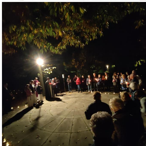
Foto:Lichtprocessie en grafzegening algemene begraafplaats Belfeld met dank aan vrijwilligers)