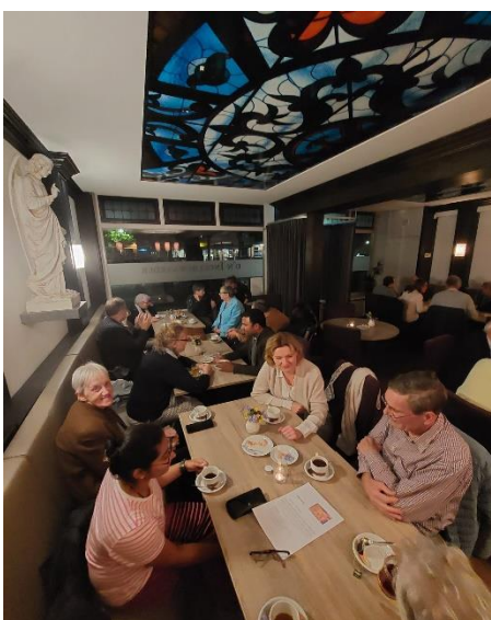
(foto: Koffiedrinken in de Ingelbewaarder. Volgende inloopmiddagen zijn: 8 november, 22 november en 20 december.)