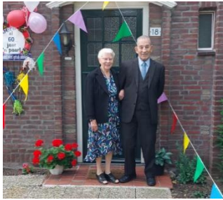
Dhr. en mevr. Verdonk-Beerse zijn 60 jaar getrouwd!