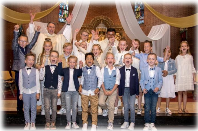
Communicanten, ouders en familie van harte proficiat! Communieviering in Belfeld was op zondag 12 Juni