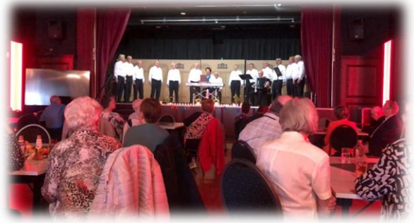
Paasviering KBO Sint Martinus en KBO Sint Joseph