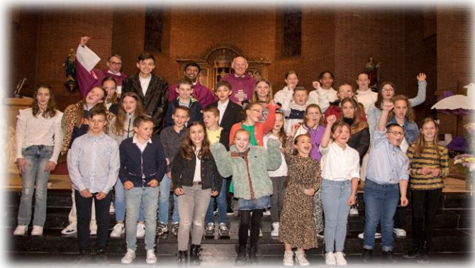
Vormelingen ,ouders en familie van harte proficiat!