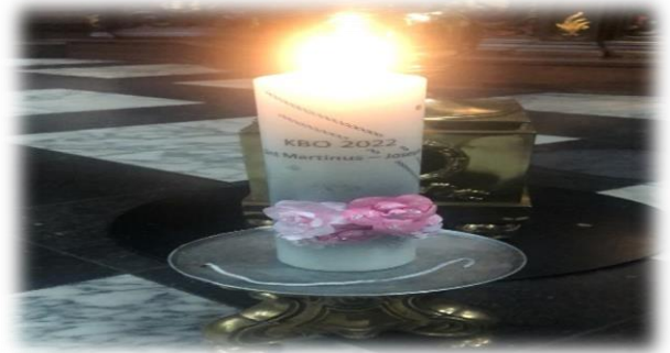
Prachtige bedevaart naar Kevelaer. KBO Sint Martinus en KBO Sint Joseph hebben een prachtige kaars naar de kaarsenkapel gebracht.

“ Wij bidden dat Gods Geest de vormelingen mag sterken in het geloof, hen begeleiden in de liefde en vervullen met hoop alle dagen van hun leven. Samen bouwen we aan de kerk van Christus. “