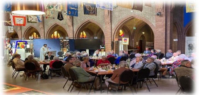
KBO Paasviering in Steyl

“ Wij bidden dat Gods Geest de vormelingen mag sterken in het geloof, hen begeleiden in de liefde en vervullen met hoop alle dagen van hun leven. Samen bouwen we aan de kerk van Christus. “