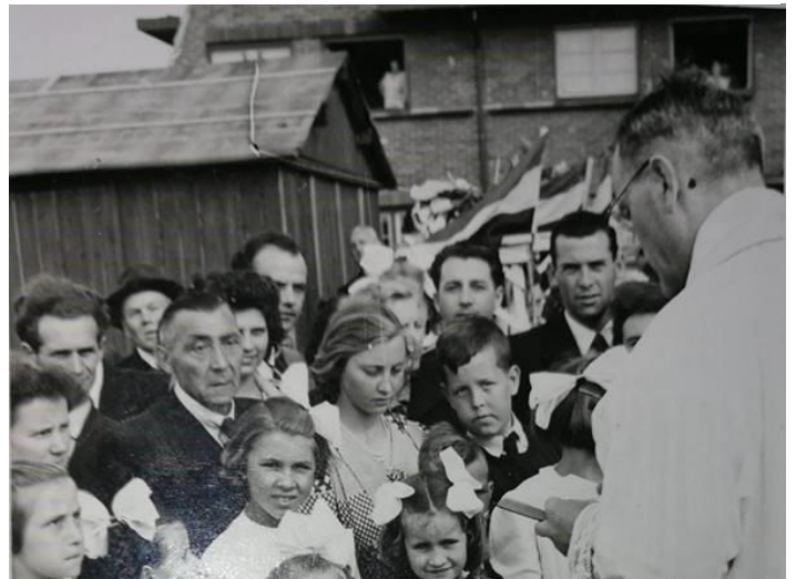
1 e steenlegging Noodkerk, Ariënsstraat, 18 juni 1950