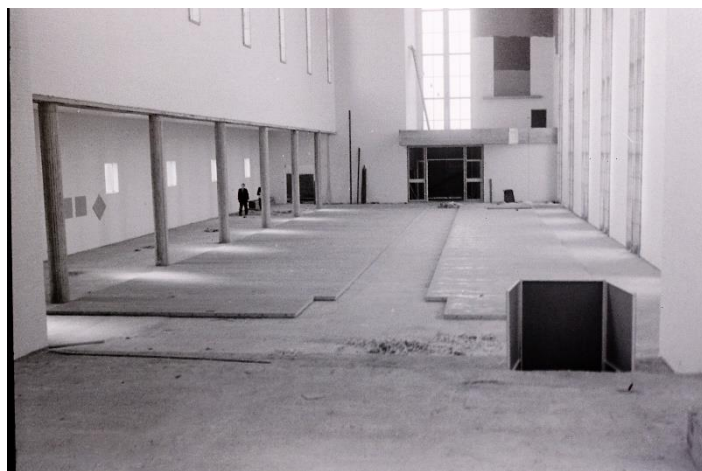
Enkele impressies van de bouw van de St. Josephkerk