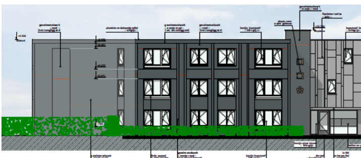
Voorgevel van de locatie in Tegelen

Het Andere Wonen BV neemt de verhuur van de zorgwoningen en het leveren van de zorg- en dienstverlening voor haar rekening.