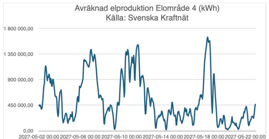
Tabell 3. Svenska Kraftnäts elproduktion vid närmaste mätstation under aktuell period

Som framgår av tabellerna är det stor överensstämmelse mellan vindstyrkor och fullstoppas vilket sannolikt ger mest torn- och fundamentvibrationer i mark.