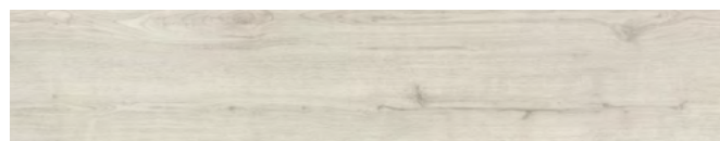
Arena Carvalho 1220x228x6 wzory: 8