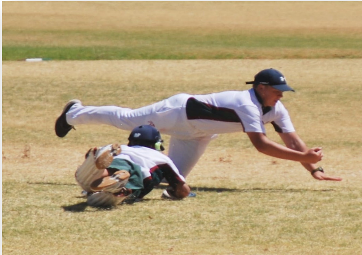
Die o.15-krieketspan se veldwerk was uitstekend in hulle wedstryd teen Worcester Gimnasium.

Mag daar nog vele hoogtepunte hierdie seisoen wees.